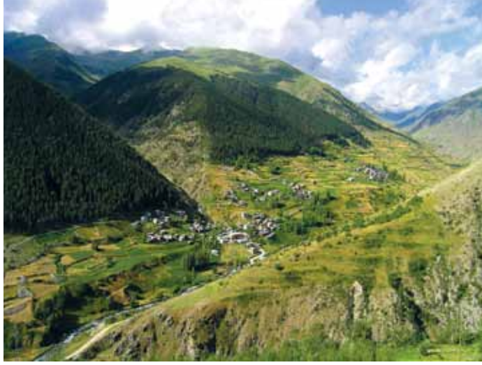
ÇORUH VADİSİ dünyanın ılıman kuşağında en zengin endemizm ve kelebek çeşitliliğini barındıran alanlardan biri.

Uçsuz bucaksız çayırlıkların üzerinde uçuyor. Daha dünyaya geleli 10–15 dakika olmuş ama sanki ezelden beri bu coğrafyada dolaşmış gibi yolunu biliyor. Genetik pusulası, ona gitmesi gereken yönü gösteriyor. Desenlerini karşı cinse tanıtırken, aynı zamanda düşmanlarına uzak durması gerektiğini söylüyor. Eşinin kokusunu kilometrelerce öteden alabiliyor, rüzgâra ya da soğuğa rağmen hiç yılmadan uçabiliyor. Eğer bir uzman “Kelebekler Hakkında Yanlış Bilinenler” başlıklı bir döküman hazırlasa oldukça uzun bir liste yapmak durumunda kalabilirdi. Ve olasılıkla listenin başına kırılğan olduklarına ilişkin yaygın inancı koyardı.