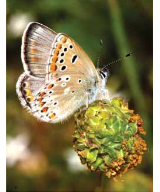
ÇOKGÖZLÜ LÜBNAN MAVİSİ ( ARICIA BASSONI )

1976'dan beri Türkiye'de kaydedilmemiş olan, Amanos Dağları'na endemik çokgözlü Lübnan mavisı ( Aricia bassoni ), Türkiye Kelebekleri Kırmızı Kitabı 'nda Yetersiz Verili (DD) olarak listelenmişti. 5 Haziran günü kelebek gözlemcileri, bu türü de yeniden kaydetti. Ekip, türü ilk kez doğal ortamında görüntüledi. Çokgözlü Lübnan mavisı, ön ve arka kanatlarının üst yüzünde, hafif kahverengi-açık mavi zemin üzerinde, dış kenarlar boyunca sıralanmış soluk turuncu benekleri, arka kanat alt yüzünün ortasında beyaz benek ve çapraz yay görünümünü bozan iki siyah beneğiyle dikkat çekiyordu.