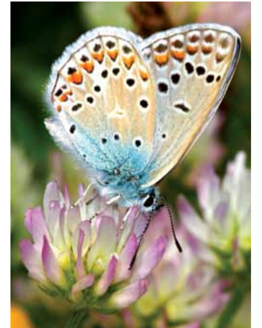
ÇOKGÖZLÜ HATAY MAVİSİ ( POLYOMMATUS BOLLANDI )