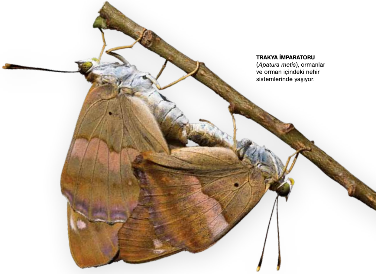
TRAKYA İMPARATORU ( Apatura metis ), ormanlar ve orman içindeki nehir sistemlerinde yaşıyor.