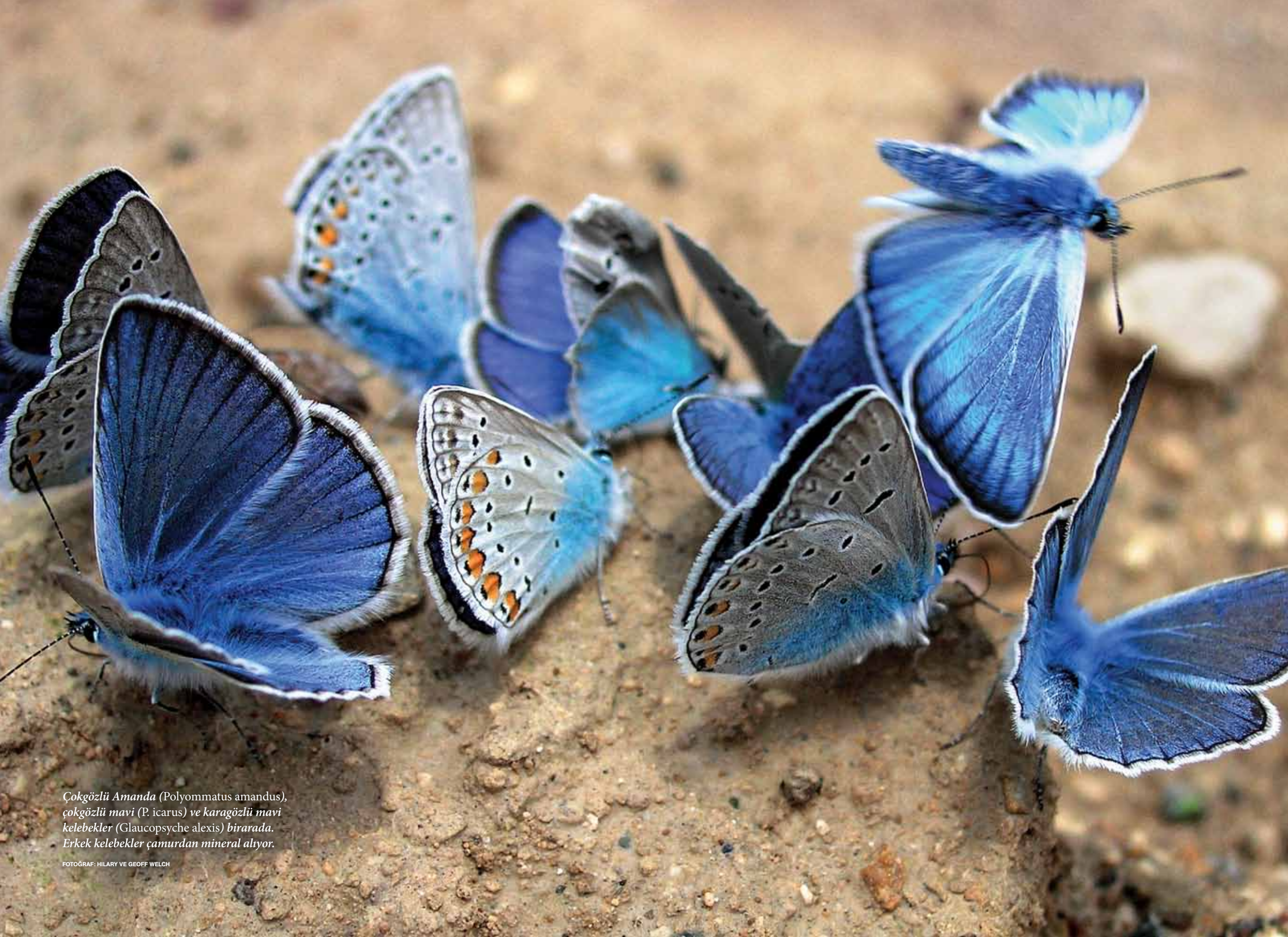
Çokgözlü Amada (Polyommatus amandus), çokgözlü mavi (P. icarus) ve karagözlü mavi kelebekler (Glaucopsyche alexis) birarada. Erkek kelebekler çamurdan mineral alıyor.