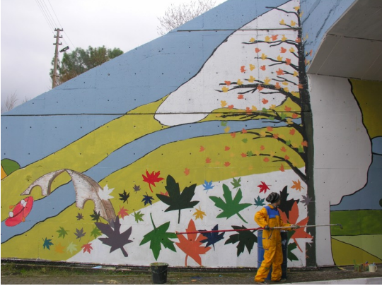
Köyceğizliler ile duvar boyama (5 Aralık 2010)