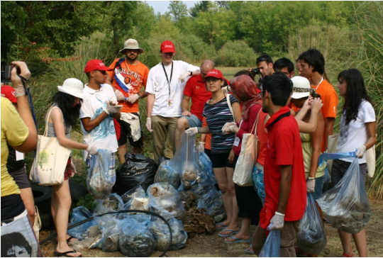
5. Dünya Gençlik Kongresi, Sığla ormanında temizlik (6-8 Ağustos 2010)

DOĞA KORUMA MERKEZİ NATURE CONSERVATION CENTRE