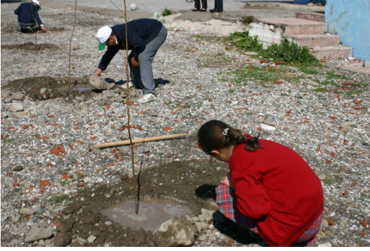
Öğrencilerle okul bahçelerinde Sığla Fidanı dikimi, (Dünya Ormanlık Günü, 21 Mart 2011)