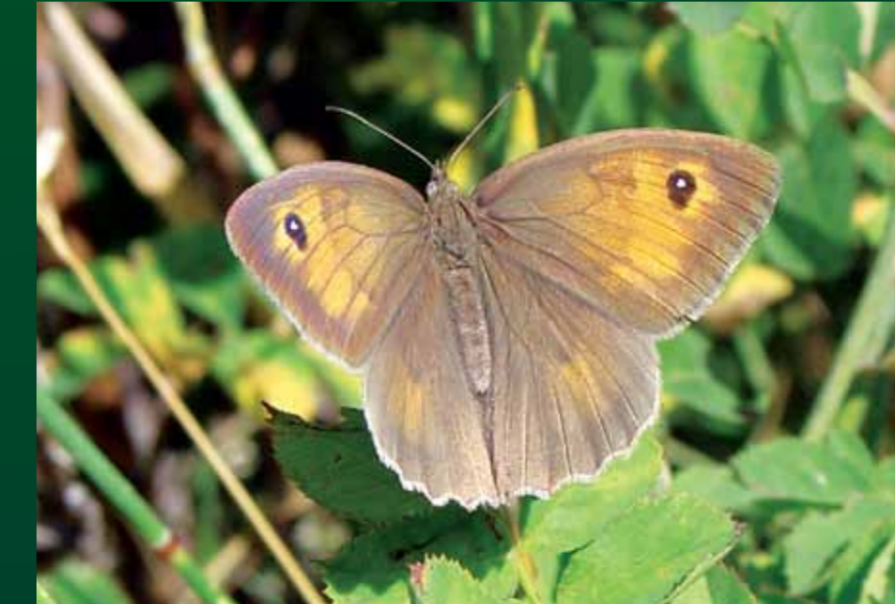
Maniola jurtina Çayır esmeri

Erkeklerindeki geniş ve düzensiz beyaz orta bant dikkat çeker. Kuru taşlık çayırda, ilkbahardan sonbahara kadar uçar.