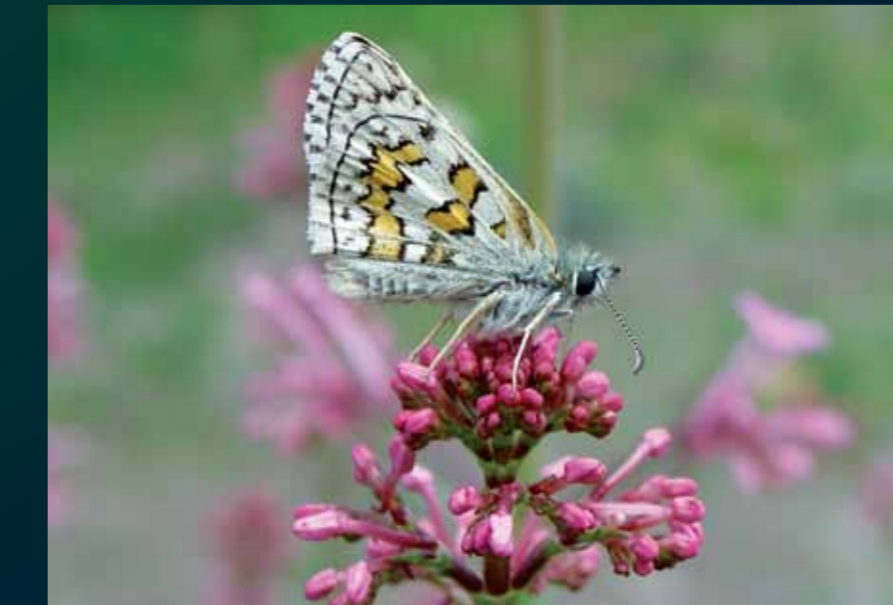
Pyrgus sidae Sarı bantlı zıpzıpı

En yaygın zıpzıplardan olan bu keleşekin benek dizilimini öğrenerek diğer zıpzıpların tanımlanmaya yönelik önemli bir adım atmış olacaksınız.