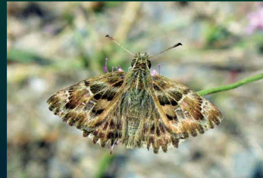
Carcharodus alcea Hatmi zıpzıpı

Bu büyük koyu renkli keleşekin uçarken kanat üstündeki beyaz bantları göze batar. İlkbahardan sonbahara kadar kurak, kayalık, çalılık orman kenarlarında veya açıklıklarında yaşar.