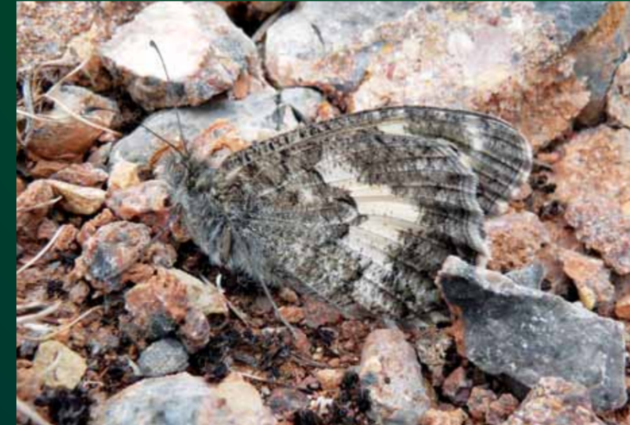
Pseudochazara anthelea Anadolu yalancı cadısı

Bu büyük keleşekin koyu kahverengi kanatlarındaki beyaz bantlar, uçtuğunda de kendisini belli eder. İlkbahardan sonbahara kadar kurak taşlık yamaçlarda ve bozkırlarda görülebilir.