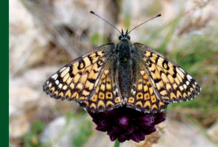
Melitaea cinxia İparhan

Orta boylardaki bu keleşek kanat arkasındaki parlak gümüş benekleriyle dikkat çeker. İlkbahar başlangıcından sonbahar sonuna kadar uçar.