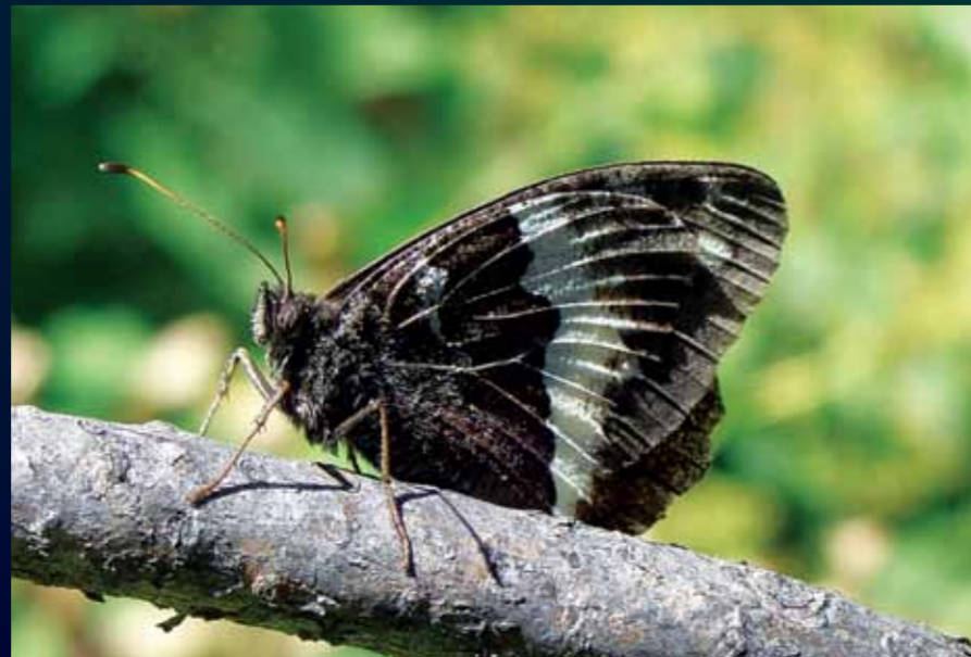
Brintesia circe Kara murat

Az güneşli alanları tercih eden bu keleşek, orman açıklıkları ve kenarlarında görülür. Kuzeyde koyu kahverengi üstüne krem lekeli iken, güneyde kahverengi üzeri turuncu beneklidir. İlkbahardan sonbahara kadar uçar.