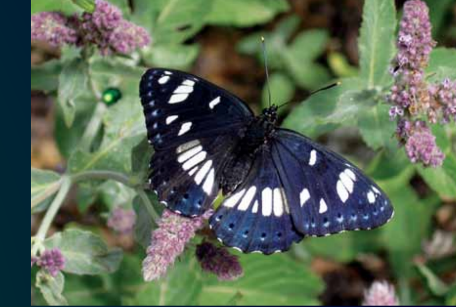
Limenitis reducta Akdeniz hanımelisi kelebeği

Parlak altın kahverengi rengi, siyah desenleri ve yırtık pırtık kanat kenarları olan bu keleşekin arka kanadının altında beyaz bir "Y" deseni vardır. İlkbahardan sonbahara kadar uçar.