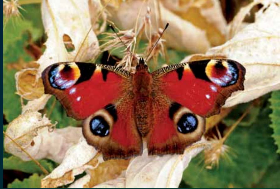
Aglais io Tavuskelebeği

Kırmızımsı turuncu kanat üstü ve mavimsi yeşil kanat kenarları ile dikkat çeker. Kişi ergin olarak kış uykusuna geçer.