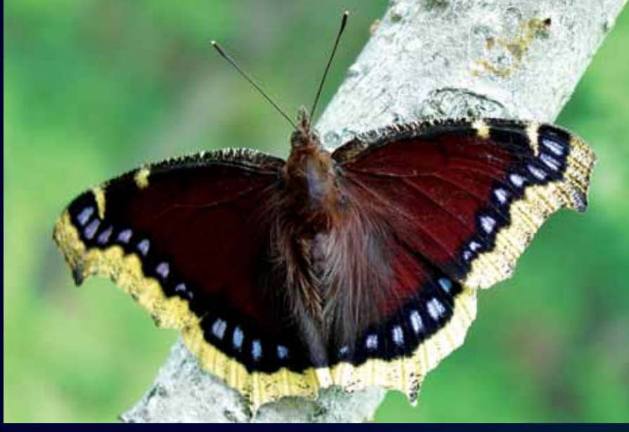
Nymphalis antiopa Sarı bantlı kadife