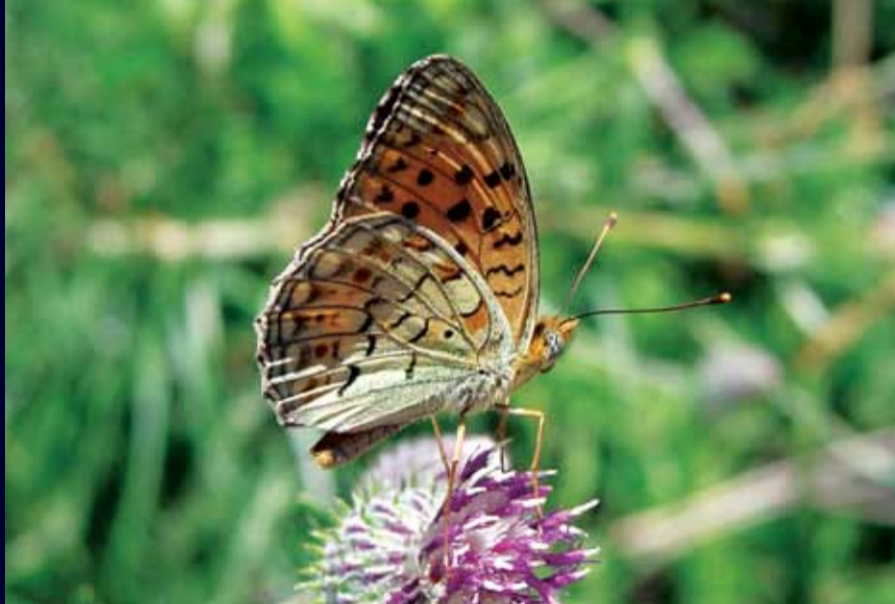
Argynnis niobe Niyobe

Kanat üstü, kadife siyah üzerine beyaz beneklidir, kanat altı ise kırmızı-kahverengi ve beyaz beneklerle dikkat çeker. Bir kere görüldüğünde unutulmamacak keleşeklerdendir.