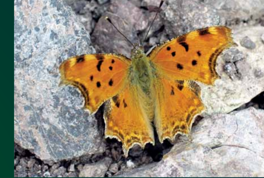
Polygonia egea Anadolu yırtık pırtığı

Göçleriyle bilinen bir diğer keleşek olan diken kelebeği genetik olarak Atalanta'ya çok yakındır. Bu tür Antarktika ve Güney Amerika dışında her kıtada bulunur.