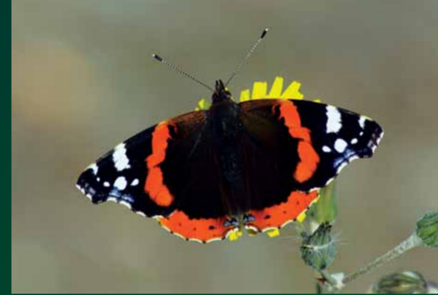
Vanessa atalanta Atalanta

Uçarken simsiyah gözükle de, konduğu anda kanatlarında belirgen büyük yeşil göz desenleri ile dikkat çeker. Türkiye'nin kuzeyinde dağılım gösterir.