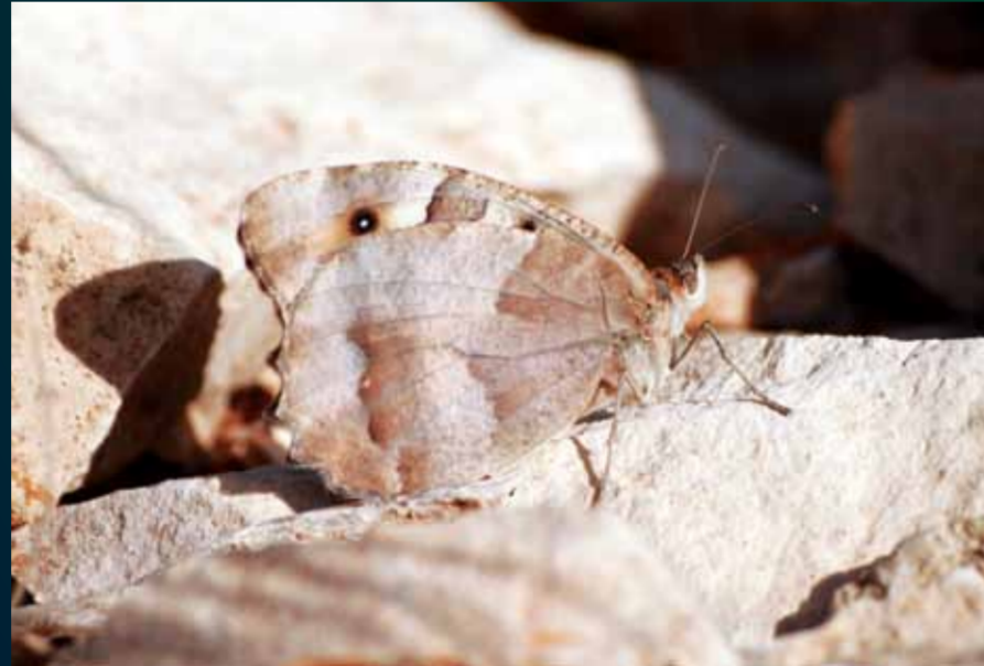
Chazara briseis Cadı

Siyah beyaz bezelli bu keleşekin kanat üstü bazal bölgesi siyahımsıdır. Yaz mevsiminde uçan bu keleşek taşlık çayırda yaşar.