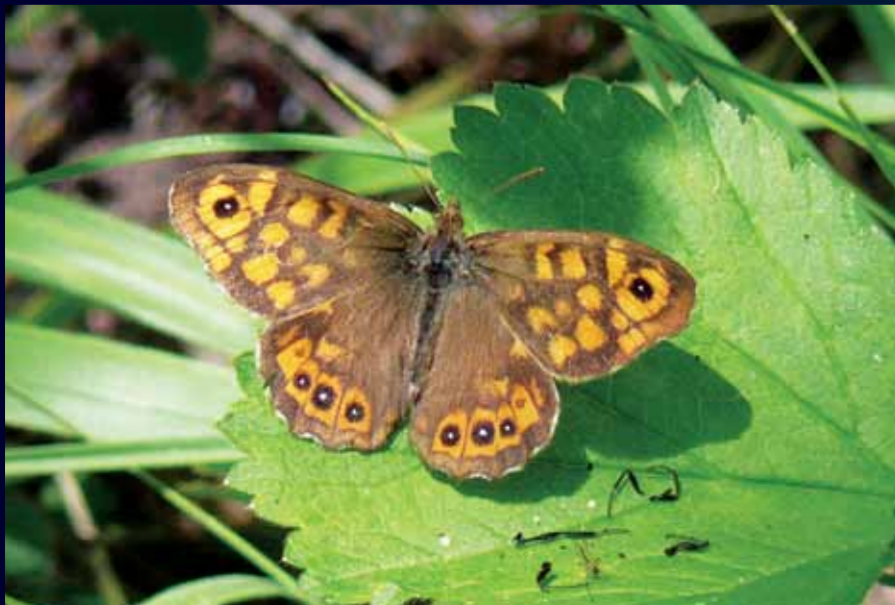
Pararge aegeria Karanlık orman esmeri

Çoğunlukla ağaçların gövdesinde dinlenen bu keleşek, gri-kahverengi rengi ve dalgalı çizgileriyle kamufle olur. İlkbahar sonbahar arası uçar.