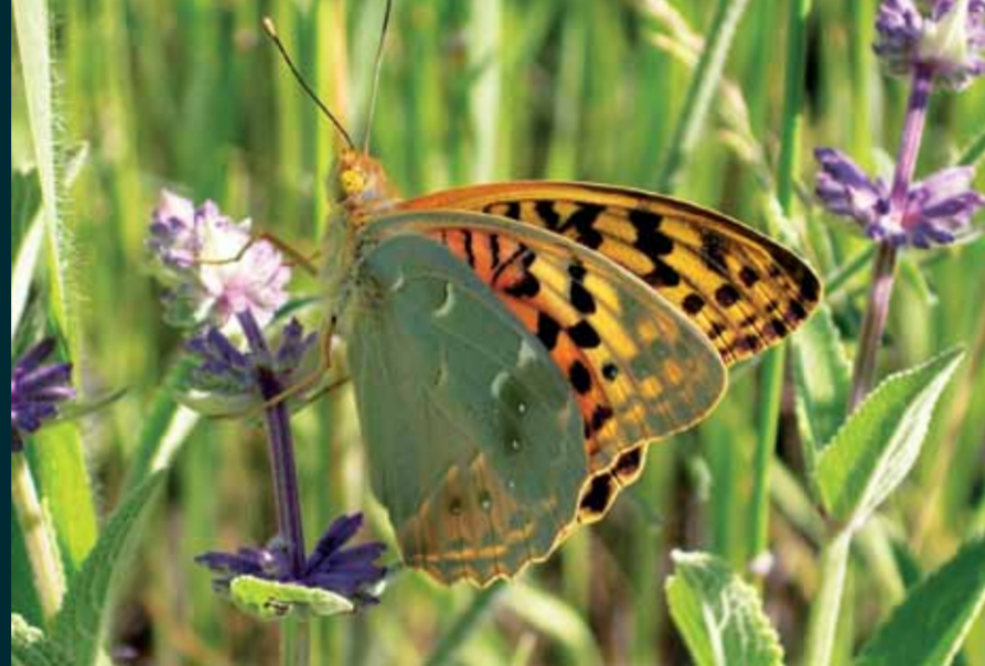
Argynnis pandora Bahadır

Kanat altındaki küçük siyah benek, türü benzerlerinden ayırır. İlkbahar ve yaz mevsimlerinde çiçekli alanlarda gözlemlenir.