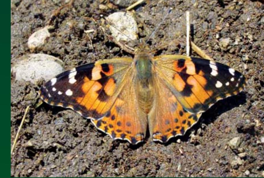
Vanessa cardui Diken kelebeği

Koyu kanatlarını kesen kırmızı bantlarıyla başka kelebeklerle karıştırılması mümkündür. Göz edebilen bu keleşek, dünyanın her tarafında bulunur.