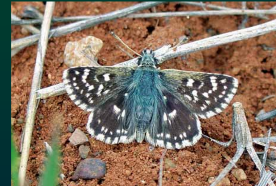
Spialia orbifer Kızıl zıpzıpı

Mermer zıpzıplarının en koyusu ve beyaz desenleri en küçük olanıdır. Değişik yaşam alanlarında en erken ve en geç gözlemlenen türlerdendir.