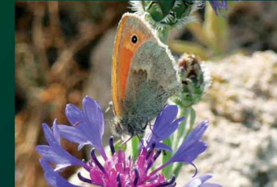
Coenonympha pamphilus Küçük zıpzıp perisi

Türkiye'deki çayır alanlarında en sık rastlanan kahverengi keleşeklerdendir. İlkbahardan sonbahara kadar uçar.