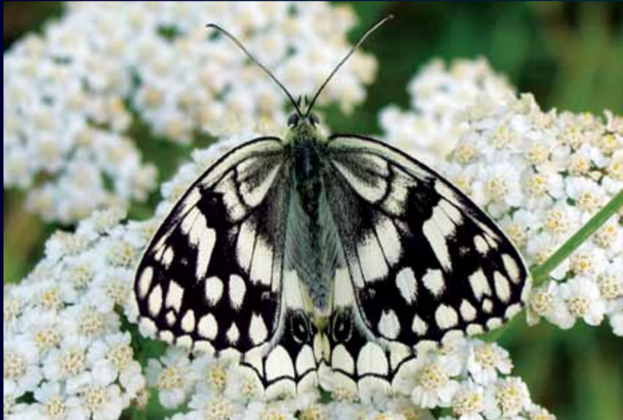
Melanargia larissa Anadolu melikesi

Kanat üst yüzü sarı, turuncu, kahverengi ve kiremit kırmızısı renginde bantlar ve siyah çizgiler taşır. İlkbahar ve yaz mevsiminde uçar. Kuzeydoğu ve güneydoğuda daha yaygındır.