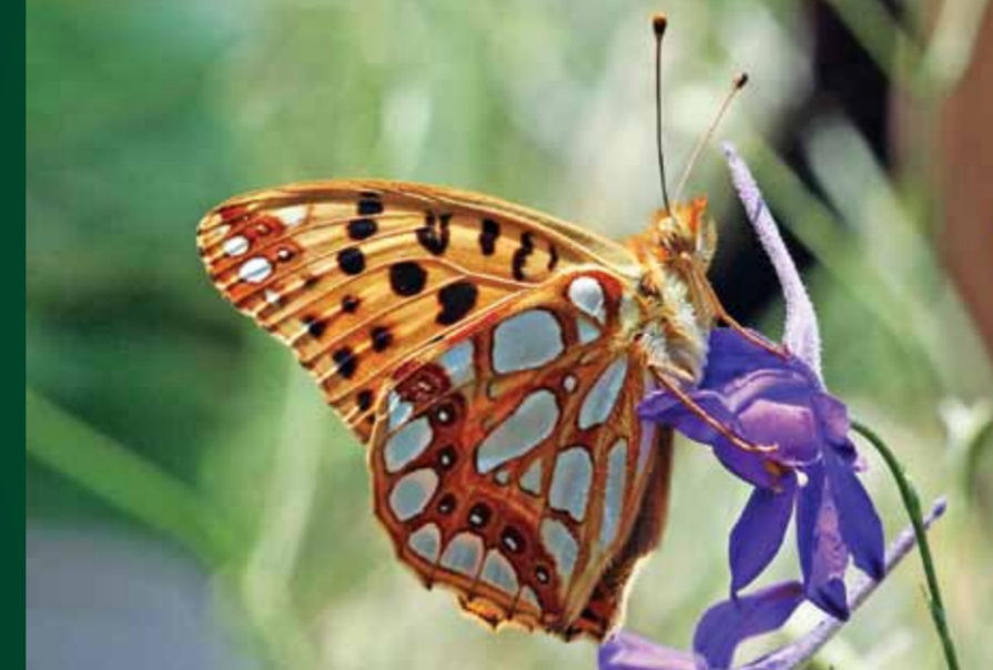
Issoria lathonia İspanyol kraliçesi

Kanat üstü yeşil tonlarına çalan bu turuncu keleşekin, ön kanat altındaki kırmızımsı dikkat çeker. Çok sık görülebilen bu keleşek, ilkbahardan sonbahara kadar uçar.