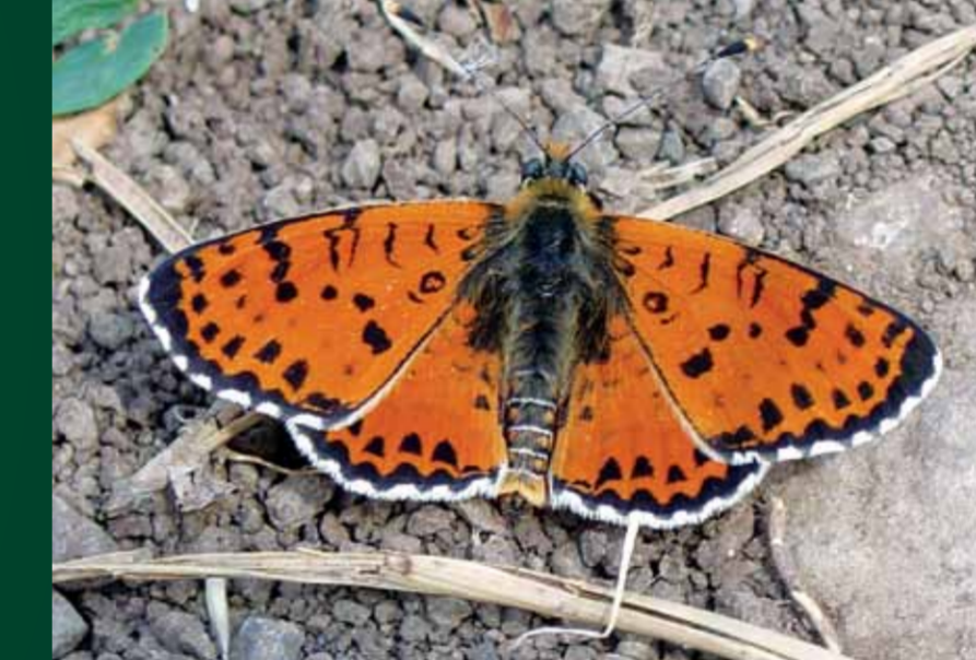
Melitaea didyma Benekli iparhan

Orta boylardaki bu turuncu keleşekin kanat arkasındaki dizi halinde siyah noktalarla dikkat edin. Yaz aylarında uçan bu keleşek Ege bölgesinde bulunmaz.