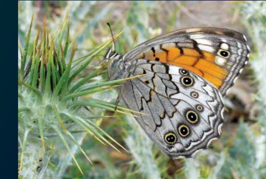
Krinia roxelana Ağaç esmeri

Her tür çayırda en yaygın görülen türlerdendir. Konduğunda kanatlarını hep kapalı tutan bu türü, küçük boyu, turuncu kanat rengi ve ön kanat altında bulunan gözbeneci ile tanımlayabiliriz.