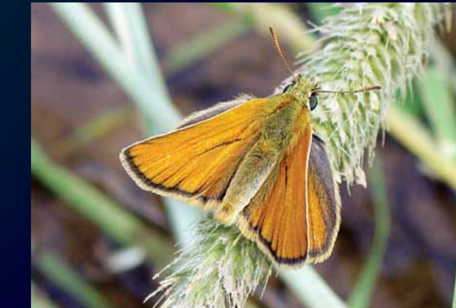
Thymelicus sylvestris Sarı antenli zıpzıpı

İlkbahar ve yaz aylarında gözlemlenen bu büyük zıpzıpın sarı bacaklarına ve kanatlarının altındaki benzersiz sarı bantlarla dikkat edin.