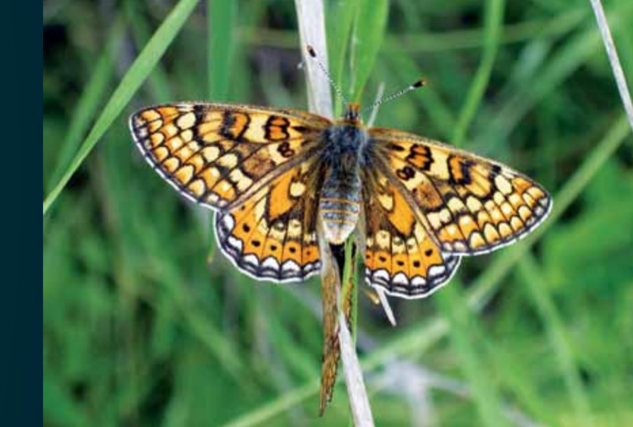
Euphydryas aurinia Nazuğum

Parlak kırmızımsı turuncu olan bu keleşekin kanat kenarlarındaki siyah benekler yuvarlak ya da dikdörtgen şeklindedir. Çiçekli çayırda ilkbahardan yaz sonuna kadar uçar.