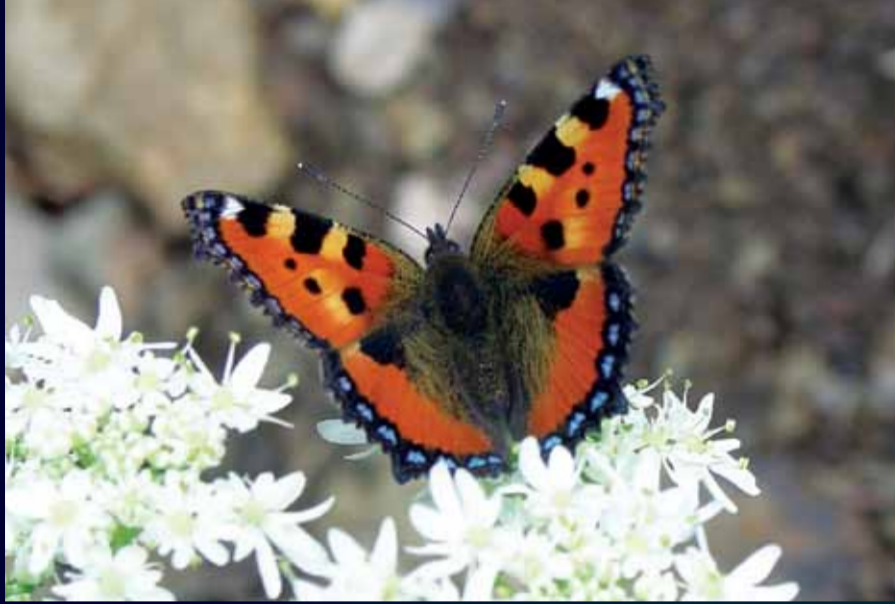
Aglais urticae Aglais

Büyükliği, güzelliği kadife renkleri ve sarı kanat kenarlarıyla dikkat çeken bu kelebeğin ilkbaharın ilk günlerinden sonbaharın bitimine kadar orman açıklıklarında, parklarda ve nemli çayırda görülebilmek mümkündür.